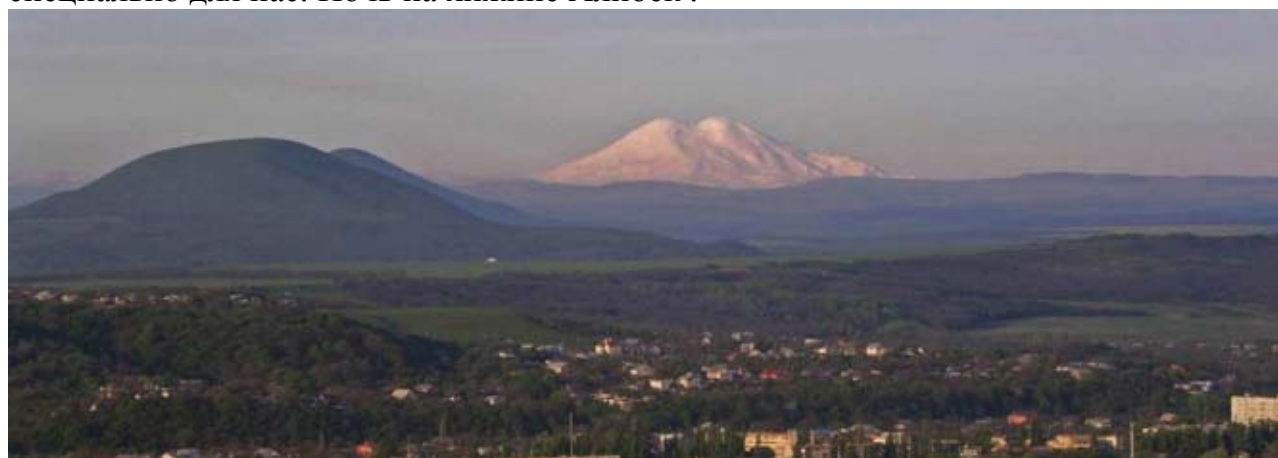
Вид из отеля Интурист

Подъем с использованием канатной дороги на пик Мусса-Ачитара 3200м, откуда открывается великолепный вид Главного Кавказского хребта и Эльбруса (подъемник до 3012м). Прогулка по хребту с отработкой альпинистской техники передвижения по скалам и скольжения по снежникам в ботинках. Возможен переход до Чучхурского перевала. Вечером шашлык из молодого барашка, приготовленный специально для нас. Ночь на хижине Алибек .