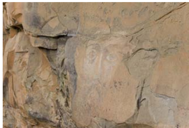
Лик Христа на горе Мицешта.