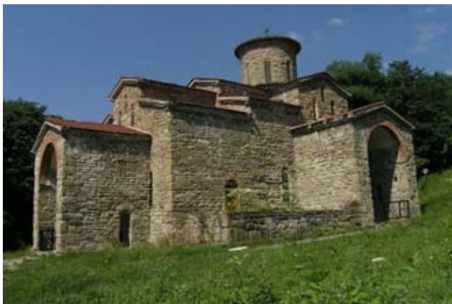
Древний собор в Архызе

Прибытие в Невинномысск (ж/д) или Минеральные Воды (авиа). Трансфер к посёлку Архыз 150 км, высота 1450 м. По пути посещение археологического музея-заповедника. Это древнее городище аланов, где хорошо сохранились 3 старейших христианских храма 9 века. Подъем к единственной в России наскальной иконе «Лик Христа», обнаруженной на скале в канун 2000-летия христианства. Рядом расположен большой телескоп. Размещение в гостинице «Архыз» в 2-3 местных номерах. Ужин.