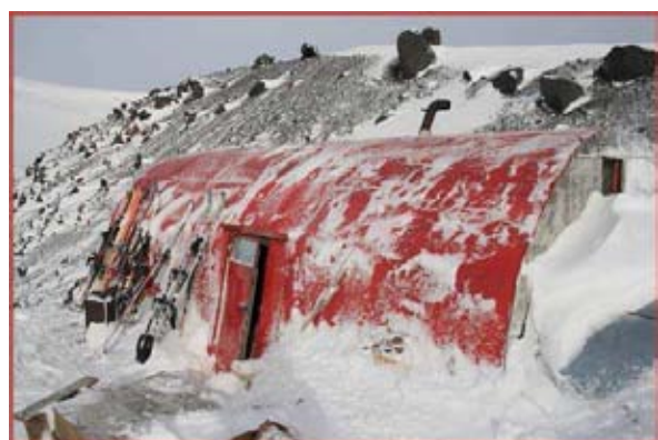
Хижина Дяди Коли

День 5. 22.05.2012 Акклиматизация на восточных склонах Эльбруса. Ночь в хижине.