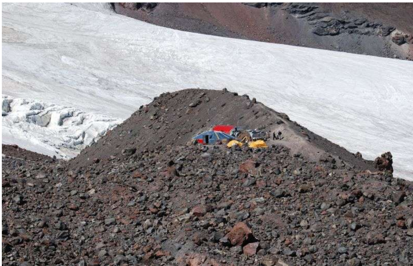
Хижина Дяди Коли 3760 метров

День 3. Акклиматизация в долину Каменных Грибов, 3200 м, - долина, где, как утверждают местные, сосредоточена сила поколений. Удивительное место по красоте и редкости фигур, выточенных ледником за долгие годы таяния. Долину наполняют причудливые формы, напоминающие грибы, возвышающиеся над полями сухой желтой травы. Возвращение в базовый лагерь Хатхансу.