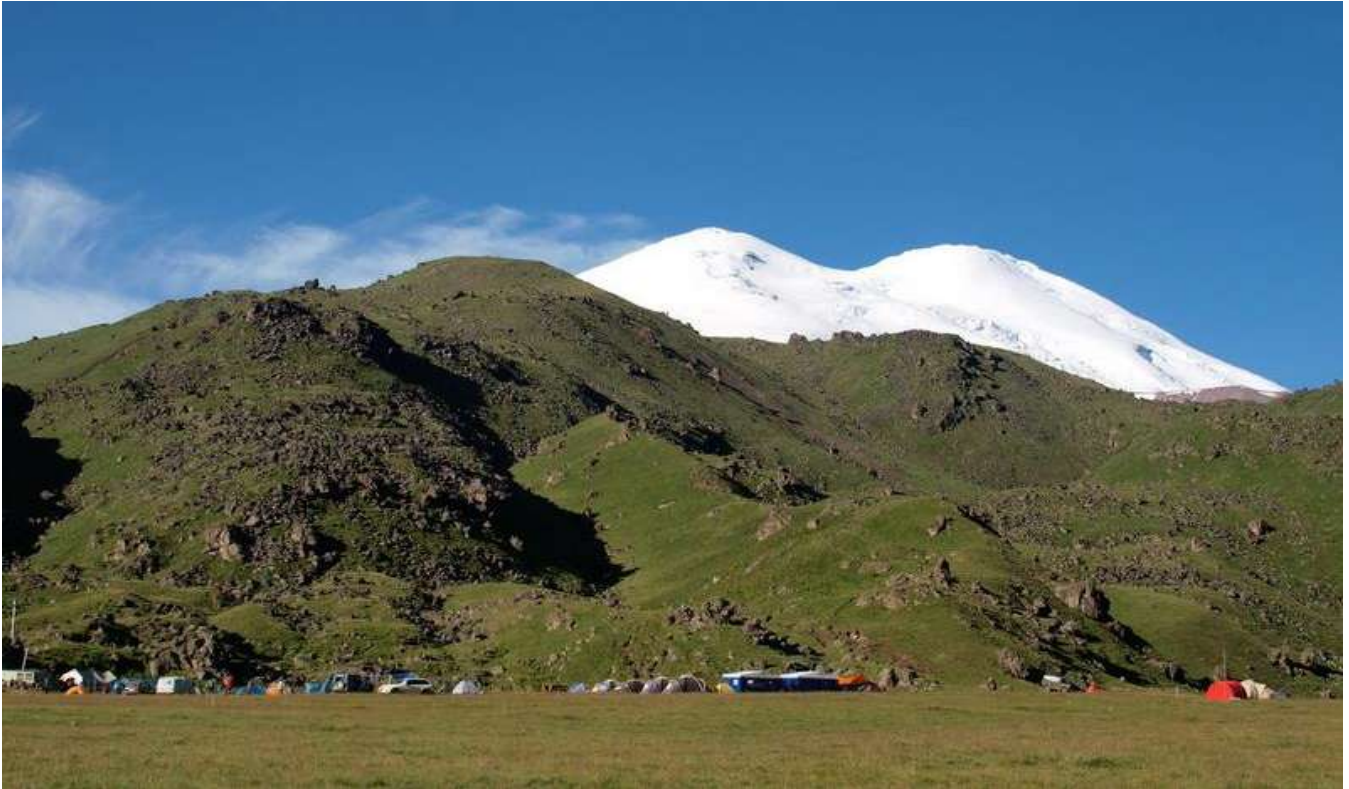
Базовый лагерь Хатхансу, 2500 метров

День 1. Прибытие в Невинномысск на поезде или самолётом через Минеральные Воды. Отправление в Пятигорск, 30 км. Размещение в гостинице «Интурист», двухместные номера.