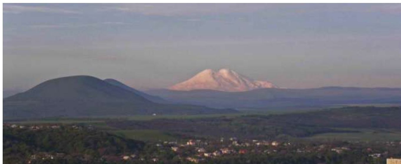
Вид на Эльбрус из гостиницы «Интурист»

День 8. Спуск в лагерь Хатхансу, 2500 метров. Трансфер в Пятигорск, 100 км. Размещение в гостинице «Интурист», откуда открывается красивейший вид на город и горы, а также отчетливо видны белые шапки Эльбруса. В этот день можно также посмотреть город, заказать экскурсию или просто посидеть в кафе.