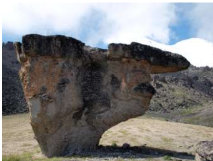
Долина Каменных Грибов, 3200 метров