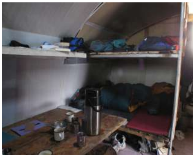
Вид внутри, хижина Дяди Коли.

День 4. Подъем к хижине Дяди Коли («Северный Приют»), 3760 метров. Хижина Дяди Коли – это последний уцелевший приют, расположенный на северном пути к вершине. Стальные утепленные конструкции, расположены прямо на границе ледника, являются надежным и уютным пристанищем для восходителей. Размещение в хижине.